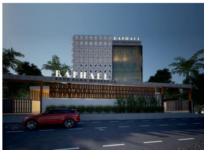
Animatie tekening van het Raphael Life Care Hospital

Tot april 2021 ging de bouw zeer voorspoedig, maar toen moest de bouw vanwege het lokale corona-beleid worden stilgelegd. Bid met ons mee, dat deze bouwstop snel zal worden opgeheven. De ziekenzorg gaat evenwel gewoon door vanuit ons voorlopige noodhospitaal. Maar dit is behelpen en we willen graag z.s.m. ons project voltooien. Dus bidt met ons mee voor een doorbraak in deze zaak. Zie hieronder een foto impressie.