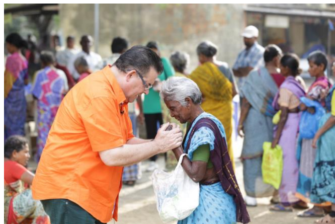
Gebed voor deze melaatse vrouw in het melaatsdorp

"Kunnen we dan geen kliniek in hun dorp bouwen", vroeg hij. "Ja, dat kan wel!" zeiden wij. "Hoeveel kost zoiets?" vroeg hij. "Er zijn 12 van deze dorpen en een kliniek kost zo'n € 50.000." zeiden we. Onmiddellijk maakte hij geld over en inmiddels zijn 2 klinieken gerealiseerd en is de bouw van de 3 e gestart. Gelukkig werd de bouw van dit project niet stilgelegd, omdat deze melaatsendorpen sowieso vrij geïsoleerd zijn. Dus kunnen we hier gelukkig wel doorgaan met bouwen. Bent u geraakt door dit project, en wilt u helpen? Uw bijdrage is van harte welkom hen namens u te kunnen zegenen en helpen. Klik hier om te doneren