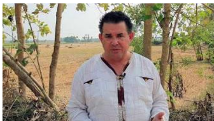
Een schitterende promo - acht jaar werk in 2.13 min. samengevat

Zoals u in deze nieuwsbrief kunt zien is het accent de laatste tijd verschoven van de kinderen en weduwen naar de zorg voor zieken, melaatsen en evangelisatie. We ervaren dat dit Gods leiding is en dat de tijd kort is. Maar het betekent niet dat we het werk onder de wezen en weduwen vergeten. Integendeel zelfs. We hebben meer weeskinderen en weduwen waar we voor zorgen dan ooit tevoren. En mede dankzij ons landbouwproject gaat het goed met de kinderen en hun sponsorouders. Velen hebben Gods liefde gezien, geproefd en omhelst. Velen van hen zetten zich nu juist in om mee te helpen met het delen van het goede nieuws van Gods liefde. Hieronder een kort filmpje dat al onze projecten in een paar minuten samenvat.