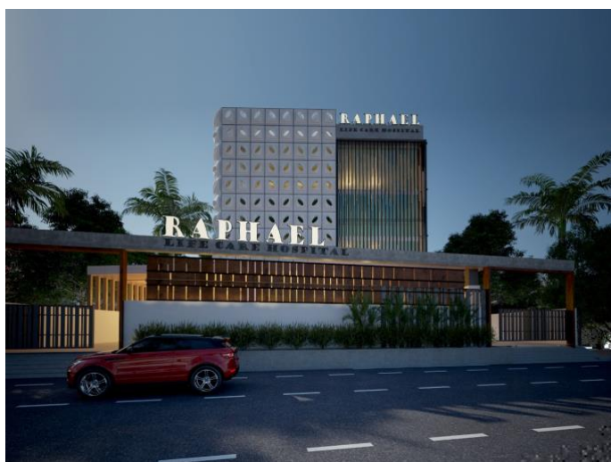
Animatie tekening van het Raphael Life Care Hospital

Vorig jaar hadden we al laten weten dat we land van de regering hebben gekregen en een miljoen euro van een sponsor om een ziekenhuis te bouwen. Met die schenking zijn we nu het "Raphael Life Care Hospitaal" aan het bouwen. En de bouw vordert gestaag. Maar we zijn ook alvast begonnen met ziekenzorg in ons voorlopige noodhospitaal, terwijl de bouw al in volle gang. Hieronder een animatie van hoe het zou moeten worden. Klik erop om meer foto's van de bouw te zien.