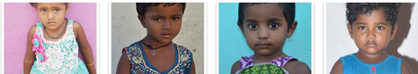
Zie hier vier van onze 30 sponsorkinderen die nog een sponsor zoeken

Wat ons werk onder de wezen en de weduwen betreft, en de landbouw projecten van de adoptieouders, dat loopt allemaal door. Feitelijk zijn we heel dankbaar dat het goed met hen gaat. Inmiddels hebben we op deze wijze en met uw hulp, al 1500 kinderen en ruim 100 weduwen een hoopvolle toekomst kunnen bieden. Hartelijk dank daarvoor!