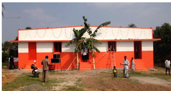
De kerk in Kunnavakkam die in januari werd geopend.

We hebben ons kerkenplan vorig jaar gelanceerd en inmiddels zijn er 3 van de 50 kerken gerealiseerd. Een van deze kerken telt elke zondag al zo'n 85 trouwe bezoekers. En ook de schooltjes draaien al volop in deze kerkzaaltjes. Maar er is meer mooi nieuws, dat we u willen laten weten.